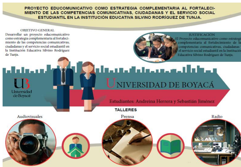
Figura 1. Infografía. Realización de la infografía presentada en la segunda reunión realizada en el I.E. Silvino Rodríguez de Tunja., fuente: autor