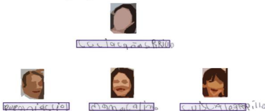
Figura 1. Nombre del grupo familiar