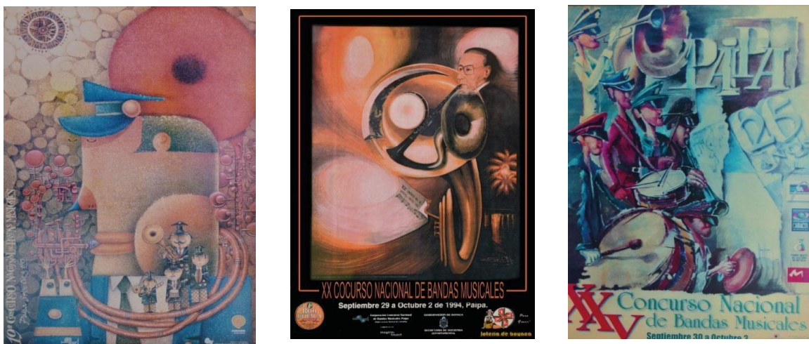
Figura 3. Carteles del concurso nacional de bandas 1993 -1999.

En la Figura 2 ya se puede ver un cambio en el diseño, se empiezan a tomar elementos ya sean fotografía o ilustración conforman un collage en la cual dan a entender lo que se festeja en la época. Es importante saber que esto en una composición actual no es bien visto, pues un cartel es un medio donde la presentación es clara, debe manejar un diseño sencillo y por lo tanto son uno de los medios más eficaces para llamar la atención de los consumidores a través de la composición de imágenes y de un mensaje concreto.