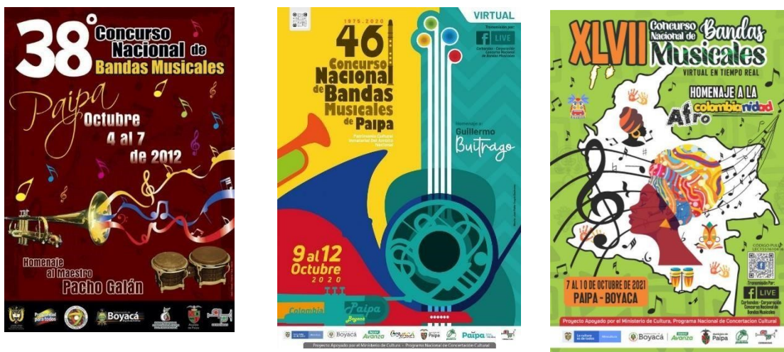
Figura 5. Carteles del concurso nacional de bandas 2012 -2021.

En la figura 4 se marcó la primera incursión en diseño digital para muchos diseñadores, era ineludible durante la década del 2000. Convirtiéndose en una necesidad en don la incorporación de procesos gráficos ayudaban y facilitaban la transmisión del mensaje creando un valor añadido