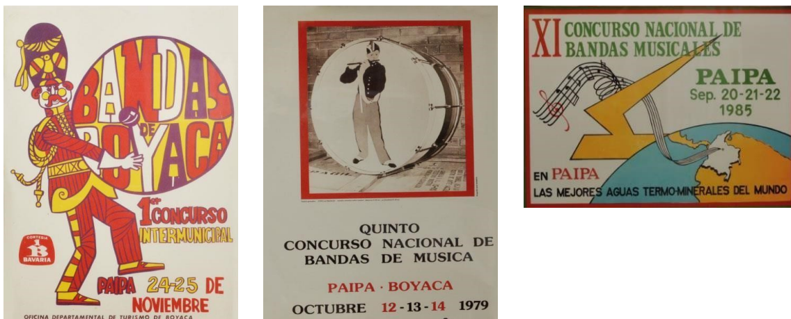
Figura 1. Carteles del concurso nacional de bandas 1973 -1985.

Al evaluar las piezas graficas de algunas versiones anteriores de manera lineal las cuales puedan dan un seguimiento de evolución en diseño como nociones de lo patrimonial, además de la realizada este año 2021 podremos notar un avance, iconografías que siempre permanecen y otras que le restan al evento.