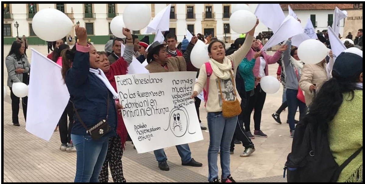
Figura 2. Marcha contra los migrantes.

Ejemplo: 23 de agosto de 2019 Marcha en contra de los migrantes en Tunja